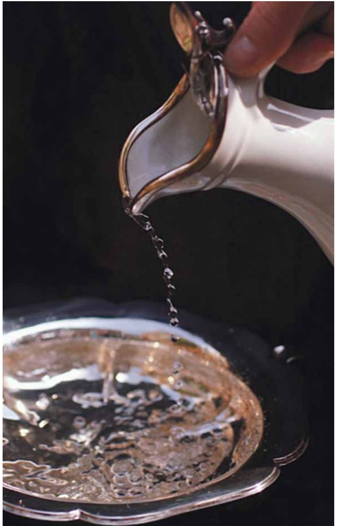
* Doopschaal en doopkan van de Doopsgezinde Gemeente Utrecht.

Overigens dateert de persoonlijke geloofsbelijdenis pas uit de negentiende eeuw. Vóór die tijd beaamden de dopelingen de vaste belijdenis die op dat moment in een bepaalde gemeente gebruikt