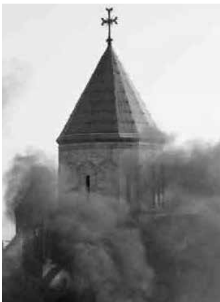
* Kerken worden bijna overal in het Midden-Oosten met de grond gelijk gemaakt.

Ik wist het: zo'n duizend jaar geleden had dat ook geklonken, in een andere taal. Niet voor het eerst trouwens, en ook niet voor het laatst. Toen klonk het: "Dieu le veut! God wil het! Dood aan de goddelozen!" Toen gold het Joden en moslims. In het bijzonder in de