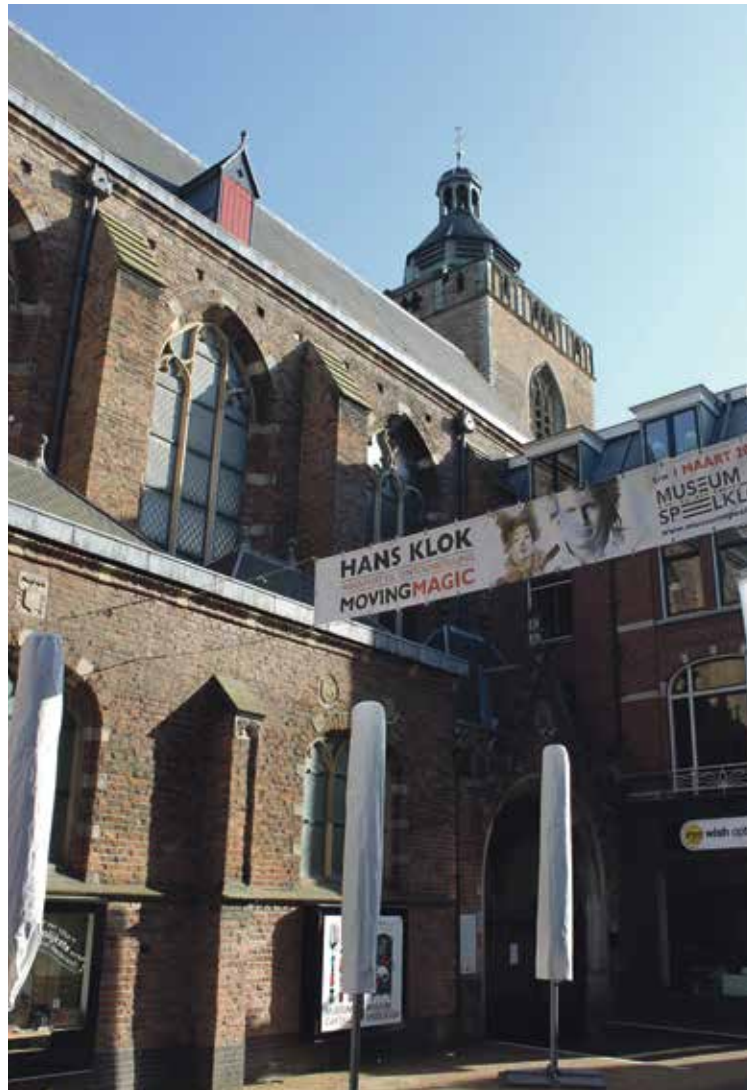
* De voormalige Buurkerk aan de Steenweg. Na de herbestemming is deze kerk museum geworden.

Het onderzoek vond plaats onder de omwonenden van de kerken. In totaal zijn er 109 enquêtes ingevuld. Daarnaast zijn er interviews afgenomen met nieuwe beheerders en eigenaren om de uitkomsten van de enquêtes te verdiepen en te nuanceren. Het blijkt belangrijk en noodzakelijk om een goede herbestemming voor kerken te vinden om deze te kunnen behouden. Herbestemming van de drie genoemde kerken heeft gezorgd voor een tweede leven van de kerkgebouwen. De kerkgebouwen kregen elk een andere functie. De nieuwe functie blijkt grote invloed te hebben op hoe de directe omgeving tegen het kerkgebouw aankijkt en in welke mate de directe omgeving verbonden is met het gebouw. De kerken met toegankelijke functie (museum en café) worden positiever gewaardeerd en bij deze functies voelen om-