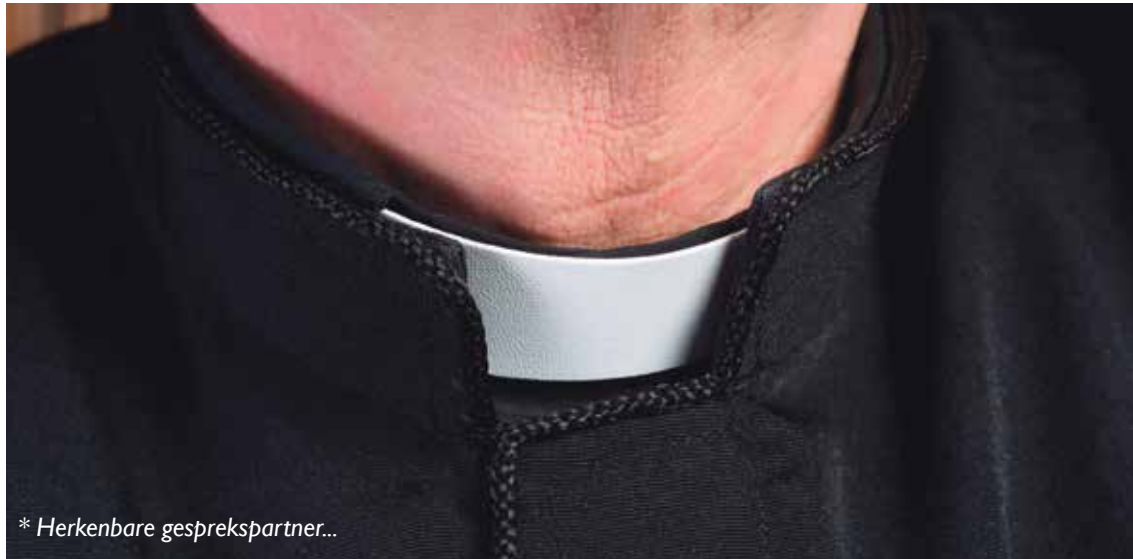
* Herkenbare gesprekspartner...

In de discussies is gelukkig (naast hier en daar wat scherpstijperijen) ook enige luchtigheid te